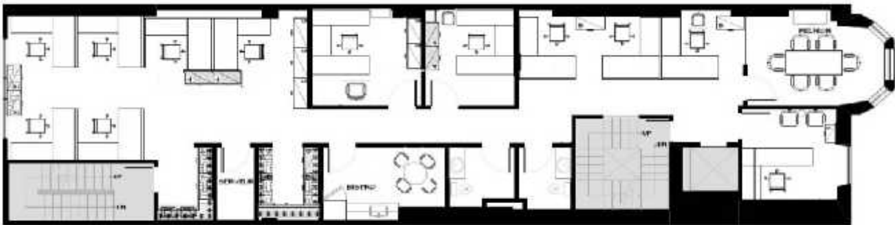
2153-2155, rue Crescent (Québec) H3G 2C1